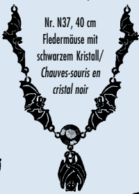
Nr. N37, 40 cm Fledermäuse mit schwarzem Kristall/ Chauves-souris en cristal noir