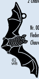
Nr. 0008, Fledermaus/ Chauve-souris